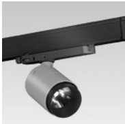
BINARI ELETRIFICATI E SPOT ELECTRIFIED TRACKS AND SPOTLIGHTS RAILS ELECTRIFIES ET SPOTS